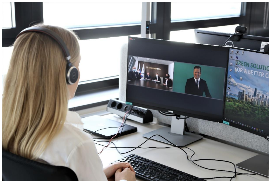
A Wiloparkban dolgozók is élőben követhették a megnyitó ünnepség digitális eseményét.

Az esemény befejezése előtt a vendégek még betekinhtettek a Wilopark legfontosabb területére, a digitális termelőüzembe. A „társadalmi távolságtartás” ellenére vendégeink virtuálisan megtapasztalhatták és közvetlen közlelől láthatták, hogy a korszerű üzemben minden egyes folyamat hálózatba kapcsolva, átlátható módon történik, és hogy az egyedi folyamatlemek és gépek készen állnak az Ipar 4.0 követelményeinek ellátására.