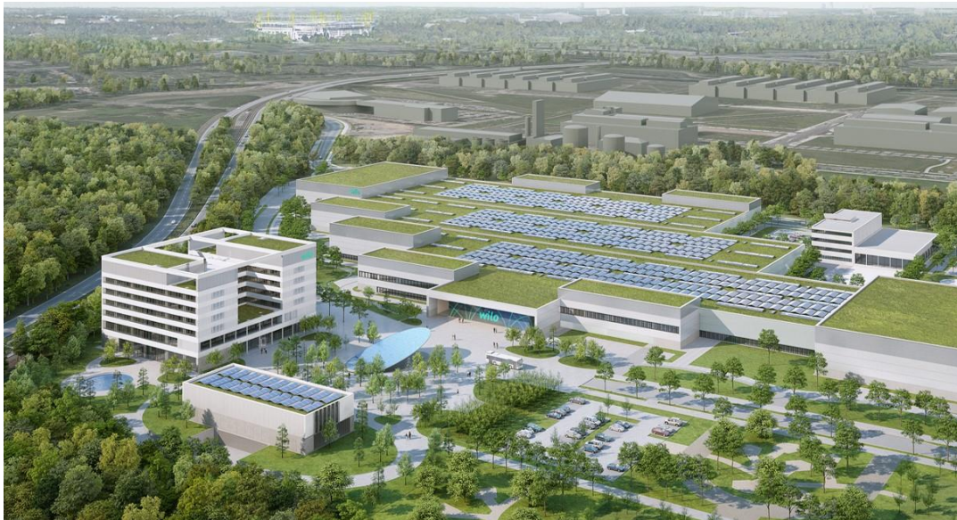
A Wilopark: a technológiára szakosodott vállalat bemutatja új digitális központját